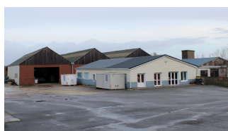
Anciennes menuiseries BDR Le Clion sur Mer