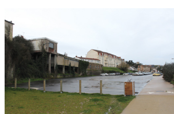
Parking gare de Pornic