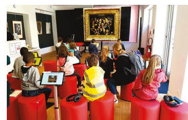
Exemple : La Micro-folie d'Auxerre

C'est gratuit et cela permet d'avoir accès aux collections des grands musées. Les contenus proposés sont culturels, ludiques et technologiques, et peuvent également intégrer des espaces de convivialité. Le coût est d'environ 40 000 € ht, dont 80% subventionné dans le cadre du programme "Petite Ville de demain".