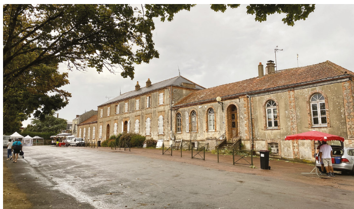
Jour de marché place de la Terrasse à Pornic 24 Août 2023 à 10h00 !

Plus que jamais VA! pense que les équipements qui avaient été proposés dans le programme de campagne en 2020 sont d'actualité et nous continuerons à les soumettre à la majorité municipale dans le cadre des projets de redynamisation des centres-bourgs.