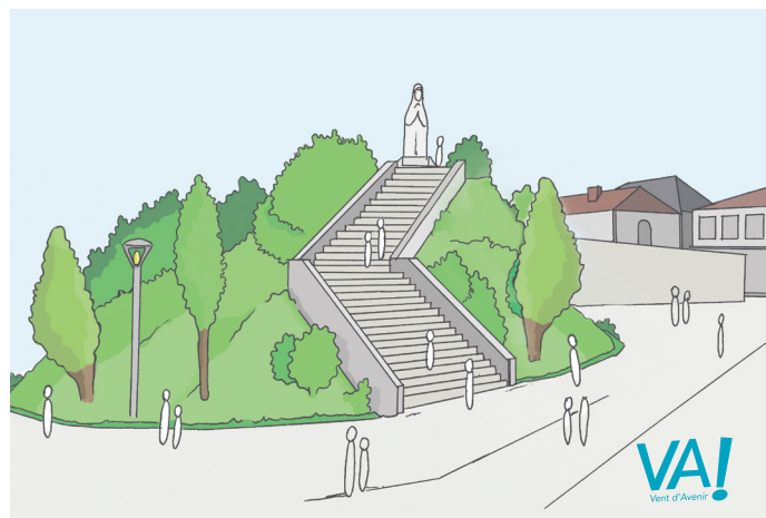
La Terrasse - Pornic