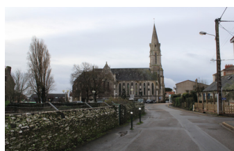
Sainte-Marie sur Mer

Lieu multi-usages pour tous : Cette halle permettrait d'accueillir tous types d'événements tels que des marchés, brocantes, bourses d'échange, vins d'honneur, ... permettant une animation du bourg hiver comme été. Ce lieu serait desservi par un transport public à l'année.